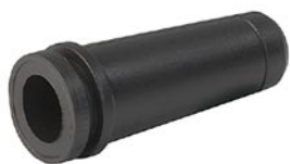
HN 14.40 PVC Knickschutztülle