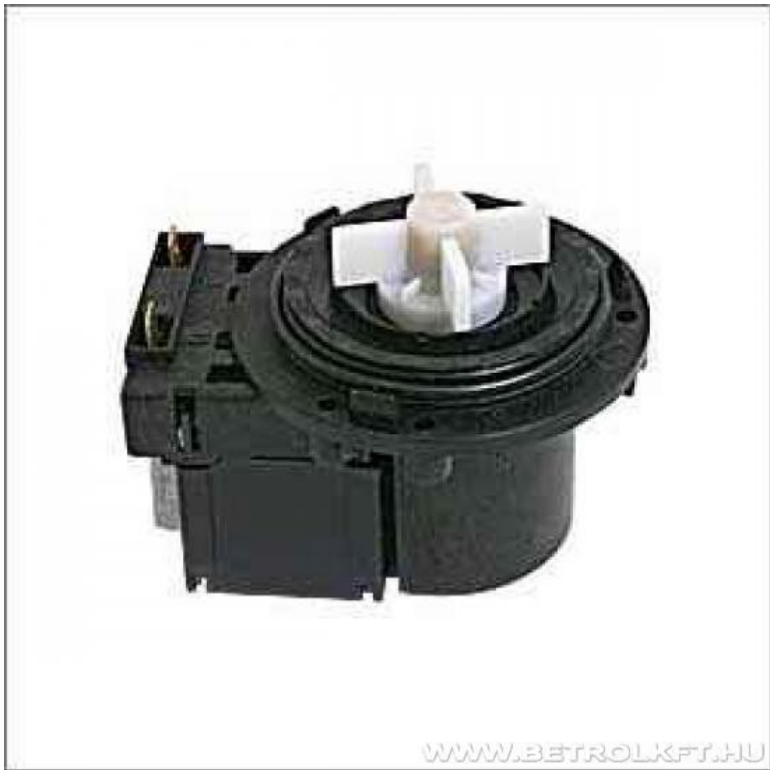
Fagor innova 2fet86-hoz msi914 univerzális szivattyú 26W Elől csatlakozású